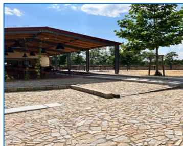
Foto 3 - zahrádka posezení