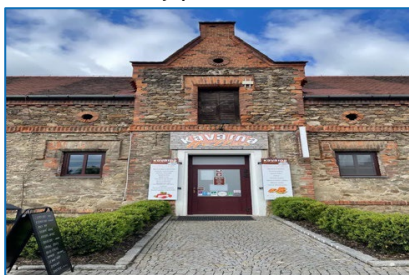
Foto 2 - bezbariérový vstup